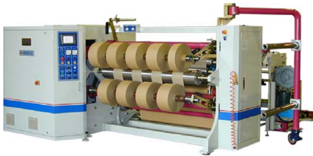
HY-EST 中心收捲分條機 適用各種膠帶分條