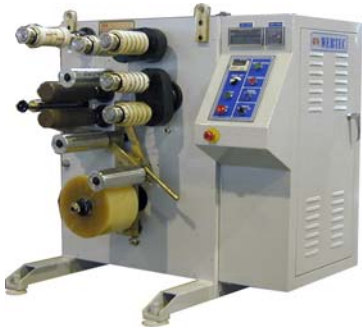
HY-MA 小型四軸交換分條機