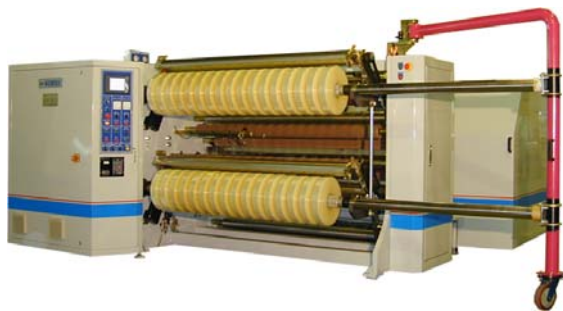
HY-TCA 中心收捲分條機 適用各種膠帶分條