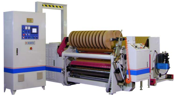
HY-EPT 中心表面分條機 適用各種膠帶分條