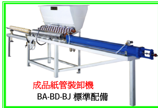
成品紙管裝卸機 BA-BD-BJ 標準配備

適用範圍: OPP, PET 膠帶分條 特殊配備: 捲取配有表面壓輪可達到無氣泡處理 最小分條: 80mm 最大捲取直徑: 180mm