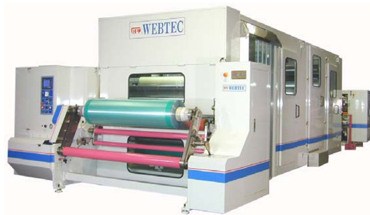
HY-SDLF-I 品檢貼合機 適用於反射膜, 增光膜, 偏光膜之檢驗貼合. (本機可選擇單一道式, 二道式, 三道式品檢) 製造寬度: 1.0M/1.3M/1.6M 放料/收捲直徑: 900mm 保護膜直徑: 500mm